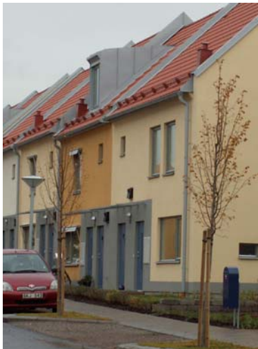
Radhus i Garnisonsområdet i Linköping

Som förebilder finns radhus i Garnisonsområdet och nybyggt stadskvarter, kv Balder. Båda områdena finns i Linköping.