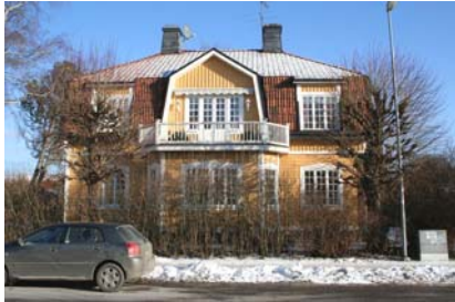
Jugendvilla på Nygatan

Bebyggelsen längs östra delen av Nygatan är delvis äldre villor med stora tomter samt radhusbebyggelse med en mindre förgårdstomt ut mot gatan. I väster domineras miljön av flerfamiljsfastigheter.