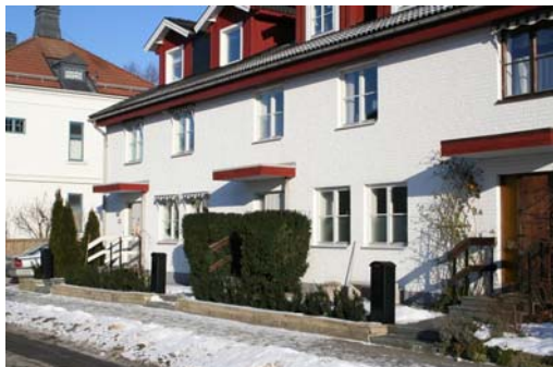
Radhus vid Nygatan