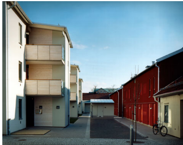
Kv Balder i centrala Linköping