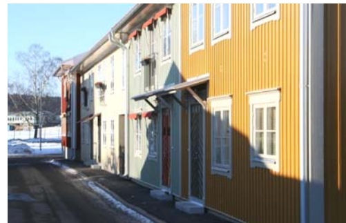
Nya bostadshus vid Kärnbogatan