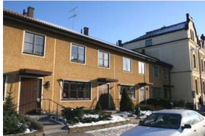
Radhus 1970-tal på Nygatan