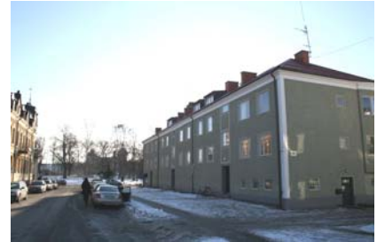
Flerbostadshus 1950-tal Nygatan